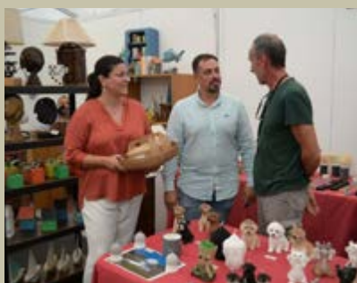
Villa de Mazo sigue reforzando su identidad artesana.

Por último, el 18 de septiembre se clausura el proyecto ‘Tagoror: Artesanías para la Paz y el Desarrollo Sostenible de Villa de Mazo’, una gran labor desarrollada en torno a la tradición artesanal y que invita a reflexionar sobre la sostenibilidad de la artesanía en el municipio.