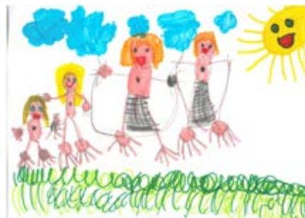
2º PREMIO: Tara Hayek (CEIP Monte Breña)