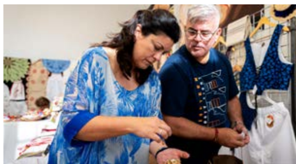
El acto reunió más de una veintena de oficios artesanos.

El evento tuvo lugar en el Mercadillo Municipal, donde se ubicaron varios stands con muestras de las distintas técnicas