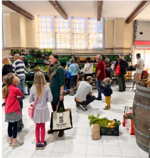
Este lugar incide en la artesanía, el producto local y el desarrollo económico municipal.

La artesanía local ocupa igualmente un lugar destacado, con la presencia de puestos de bordado, cerámica, artículos de cuero, macramé y piezas realizadas con materiales reciclados, reflejo del talento creativo del municipio y del compromiso