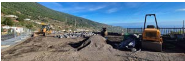
Obras de mejora del mirador de El Lomo.