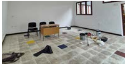
Mejora de instalaciones para el aula UAEF.