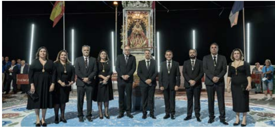
El municipio y sus tradiciones estuvieron presentes en las Fiestas Lustrales.

El municipio dejó su huella, reforzando así el vínculo histórico y emocional que une a Villa de Mazo con la Patrona de la isla y con una de las tradiciones más arraigadas de la identidad palmera.