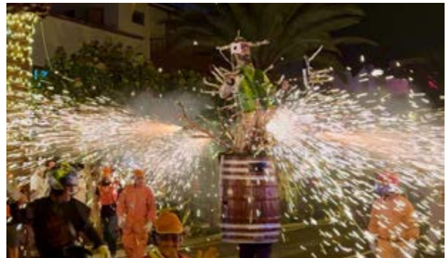
El Borrachito Fogatero.

La Banda del Aula de Música Municipal interpretó por primera vez en directo la melodía del Borrachito Fogatero, aportando un elemento novedoso a una de las representaciones más populares del calendario festivo.