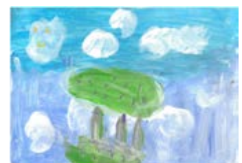
Aray Langen de Paz (CEIP Monte Breña)