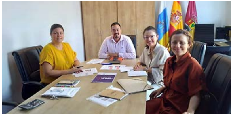
El programa 'La Palma X el Empleo' apuesta por la creación de puestos de trabajo.

Con este proyecto, el Ayuntamiento consolida su apuesta por la creación de puestos de trabajo dignos y el apoyo a emprendedores y trabajadores del municipio.