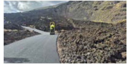
Asfaltado pista del Porís.