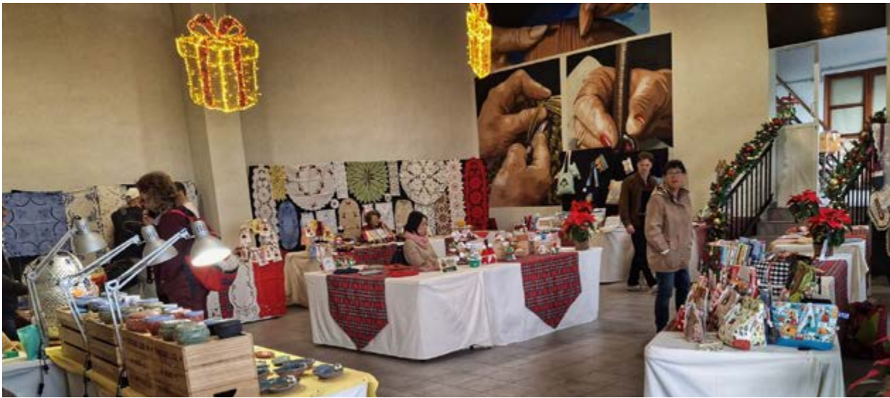
El Mercadillo Municipal se convirtió en un escaparate de la artesanía palmera.