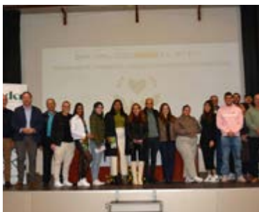
El alumnado obtuvo el Certificado de Profesionalidad Nivel 2.

Además, la acreditación vinculada al programa permitió al alumnado obtener el Certificado de Profesionalidad Nivel 2, que habilita para el desempeño de distintas funciones en centros de atención sociosanitaria y ayuda a domicilio.