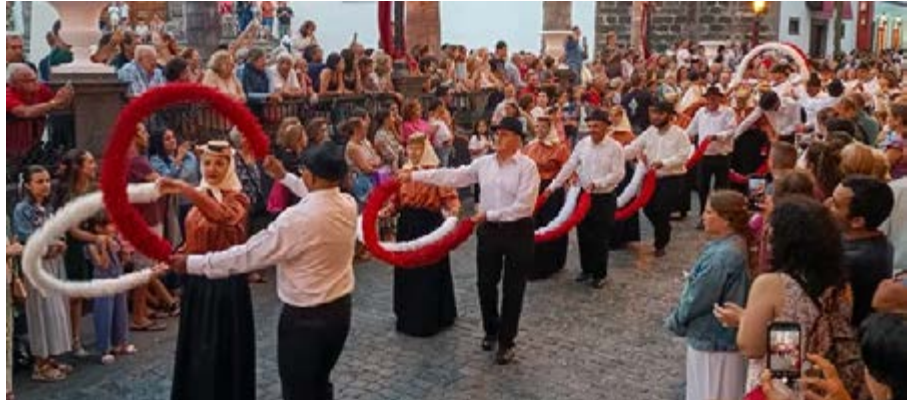
Las tradiciones macenses llenaron las principales calles de Santa Cruz de La Palma durante las Fiestas Lustrales de 2025.

Esta intervención recupera una de las expresiones tradicionales vinculadas a las fiestas del copatrono San Lorenzo en Mazo y demuestra la riqueza cultural del municipio al integrarse en una celebración que combina historia, música y danza popular.