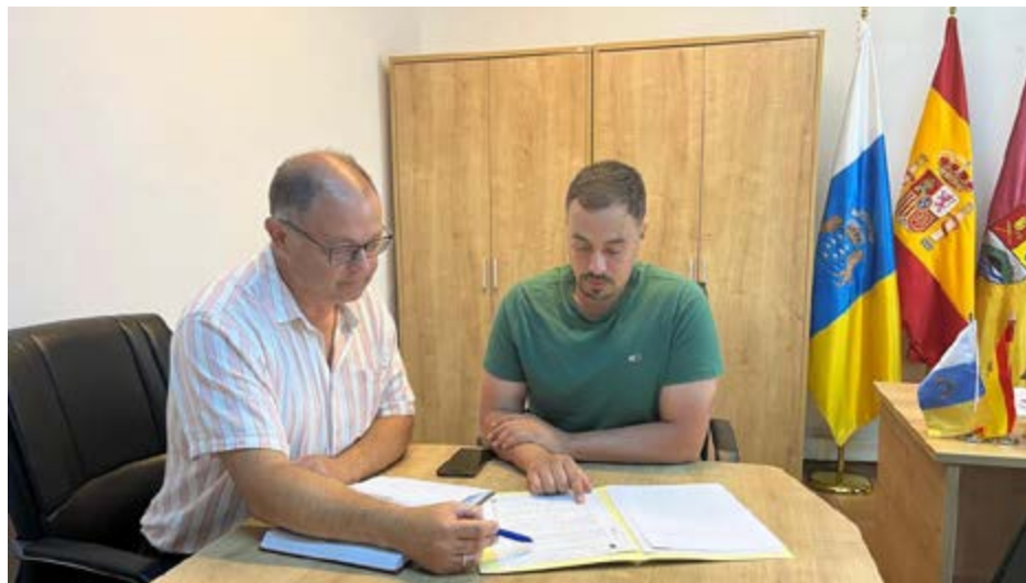
Las ayudas permiten a profesionales ganaderos y agrarios sufragar gastos habituales asociados a su trabajo.

Las ayudas se dirigieron a agricultores y ganaderos del municipio y permitieron sufragar gastos habituales asociados a su trabajo diario, como el suministro