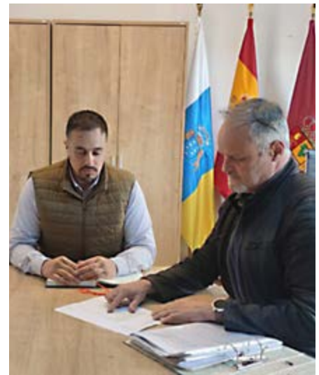
La acción apuesta por un modelo de municipio más habitable y sostenible.

vincular la rehabilitación con la reducción de emisiones, el impulso a la economía local y el arraigo de la población en barrios y zonas rurales. Entre las actuaciones subvencionables se incluyeron reformas destinadas a mejorar la accesibilidad y la adaptación funcional de las viviendas, así como inter-