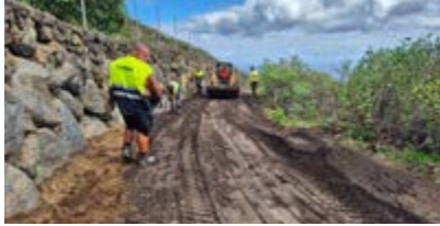
Mejora y asfaltado de la pista de la Chichara en Malpaíses.