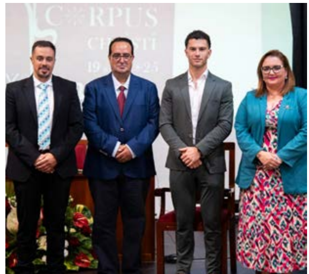
La festividad cuenta con un amplio programa de actividades para todos los públicos.