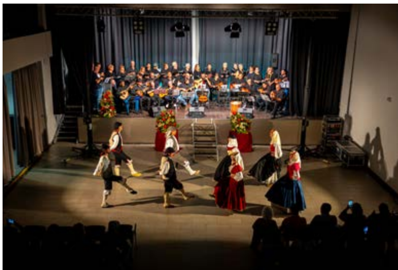
El acto pone de relieve la transmisión intergeneracional de las tradiciones musicales.