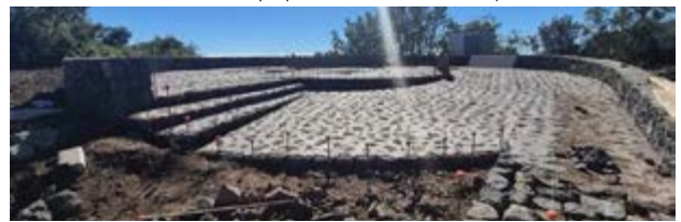
Mirador Astronómico Las Toscas.