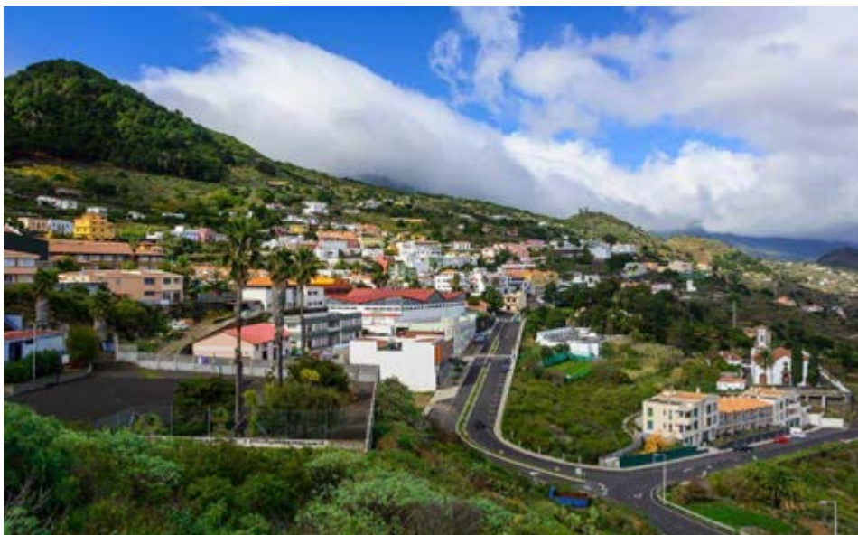
El municipio registra cifras históricas de población.