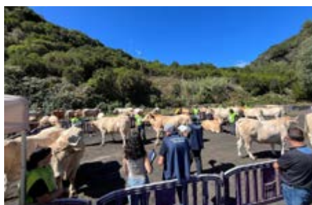
El evento reconoce el trabajo de profesionales del sector primario.

El evento, que organizó la Asociación Nacional de Criadores de Ganado Selecto de Raza Palmera (AVAPAL), fue una oportunidad para reivindicar el trabajo que desarrollan los ganaderos y ganaderas dedicados a