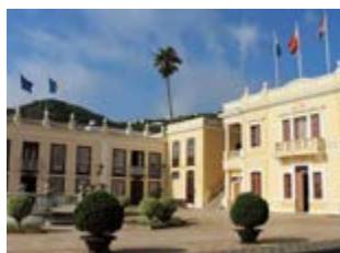
El proyecto incluyó el reparto de boletos por compras en los establecimientos adheridos y el sorteo de premios económicos para invertir en el comercio local.

El Ayuntamiento de Villa de Mazo, en colaboración con la Asociación de Empresarios, Profesionales y Autónomos Macenses (ASEPAMA), desarrolló durante la pasada campaña navideña una iniciativa de dinamización comercial con el objetivo de incentivar las compras en el comercio local y apoyar de manera directa al tejido empresarial del municipio. La campaña fue el resultado del trabajo coordinado entre la administración local y el colectivo empresarial, consolidando una línea de cooperación que permitió unir esfuerzos para fortalecer la economía local en unas fechas clave para el consumo. Además de las acciones promocionales y el reparto de premios, la iniciativa supuso un valor añadido para los establecimientos participantes, que pasaron a formar parte de ASEPAMA como socios durante el año 2026. El proyecto incluyó el reparto de boletos por compras en los establecimientos