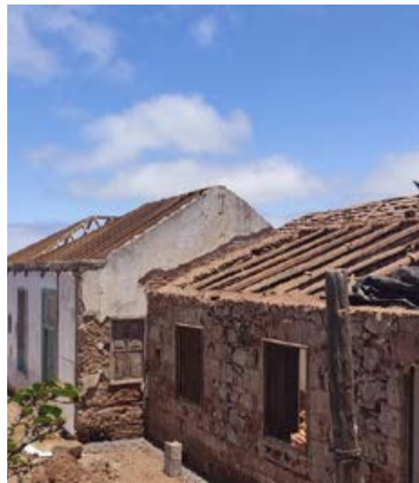
La iniciativa busca frenar la despoblación del medio rural.