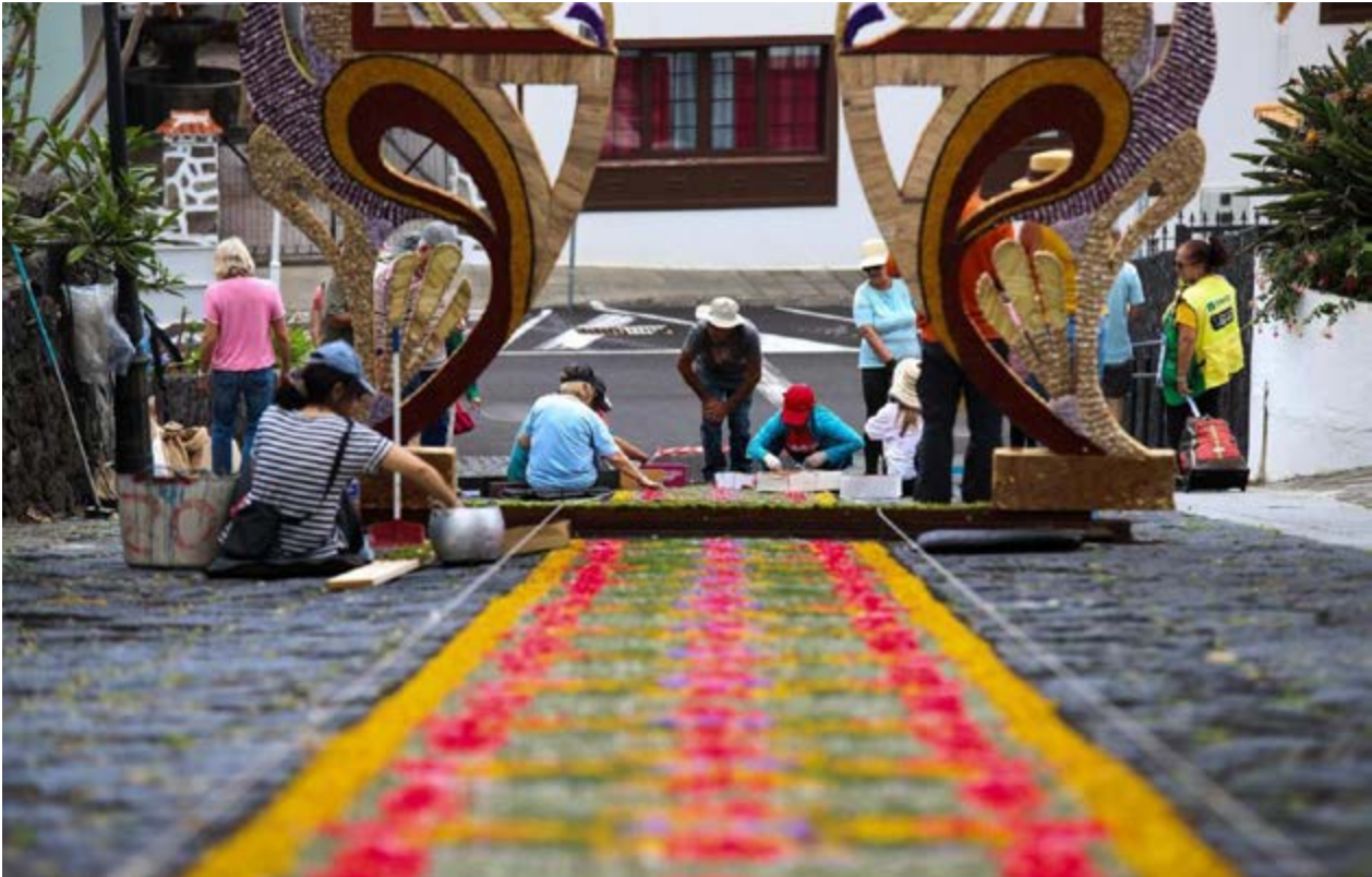
Las vecinas y los vecinos de Villa de Mazo participan en la procesión del Corpus Christi.