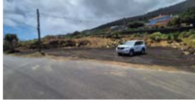
Desmonte solar municipal en Montes de Luna.