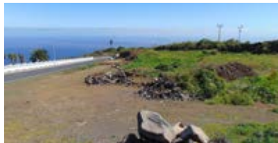
Adquisición parcela junto al campo de fútbol.