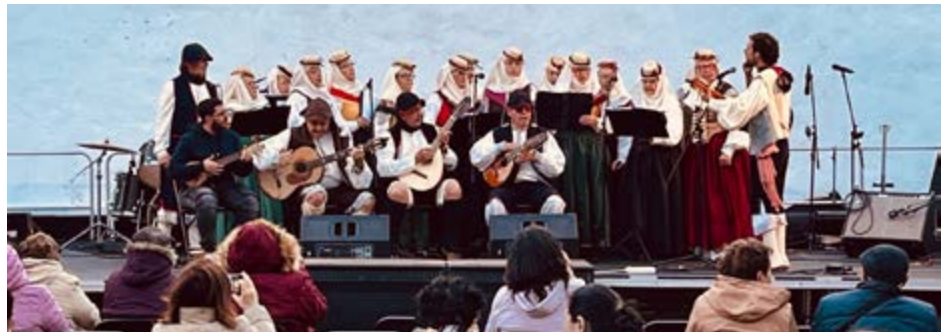
Esta festividad es una seña de identidad para Montes de Luna y para el municipio.