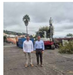
La actuación permite mejorar las infraestructuras deportivas y educativas del municipio.