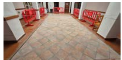
Mejora patio central de la Residencia de Mayores.