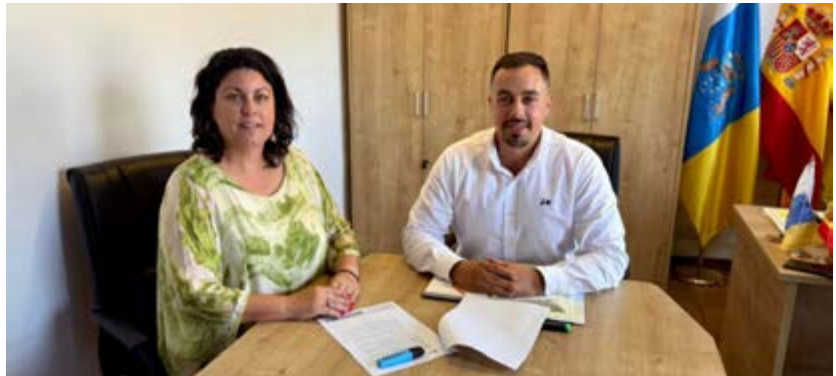
La evolución histórica de este dato refleja el impacto positivo de las políticas del actual equipo de gobierno.

Esta puntuación de 9,21 nos llena de orgullo y refuerza nuestra convicción de seguir mejorando cada día". La evolución histórica de la puntuación del Ayuntamiento en el ITCanarias refleja el impacto positivo de las políticas implementadas por el actual equipo de gobierno.