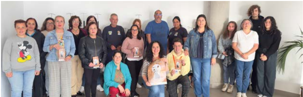
El Ayuntamiento apuesta por generar espacios de aprendizaje y reflexión.

del turismo sostenible y herramientas para su aplicación profesional. Estas actividades impulsan las oportunidades de especialización adaptadas a la evolución del mercado laboral y a los nuevos nichos de empleo.