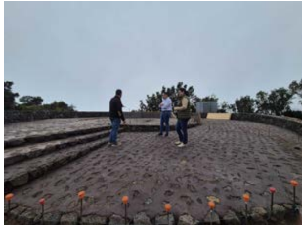
Mirador Astronómico de Las Toscas.