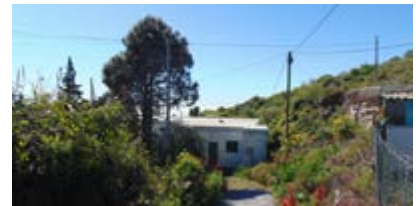
Cambio cubierta depósito municipal de La Sabina.