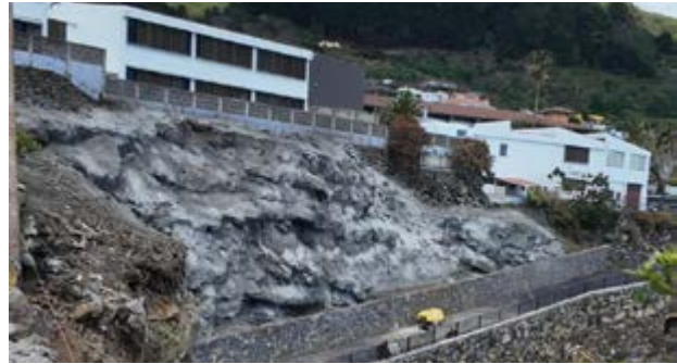
El Ayuntamiento sigue mejorando las infraestructuras públicas y espacios educativos.

Los informes técnicos destacaron la caída de rocas de hasta 1,80 metros de diámetro y la acumulación de escombros procedentes de la ladera localizada al norte del edificio. Tras analizar la zona, se optó por la instalación de un sistema de malla de triple torsión. De este modo, se minimizó el riesgo de deslizamientos y se