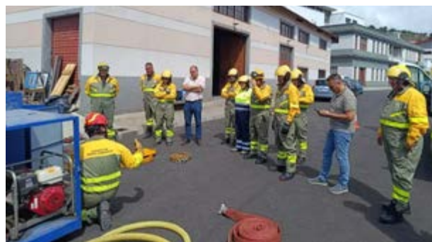
La actividad contó con ejercicios prácticos centrados en distintos aspectos clave de cara a estas intervenciones.

La actividad se desarrolló con la colaboración del área de Medio Ambiente de Parques Nacionales