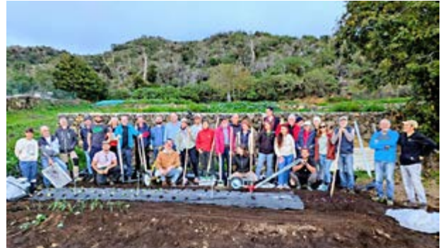
Esta acción refuerza el compromiso con el sector primario y modelos de producción sostenibles.

Con esta iniciativa, el Ayuntamiento de Villa de Mazo reforzó su compromiso con el sector primario y con la promoción de modelos de producción más sostenibles, apostando por la formación como eje del desarrollo local.