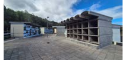
Construcción nichos San Urbano.