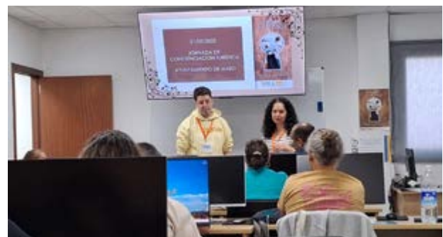
La iniciativa promueve una visión compartida de un mismo ecosistema.

Durante la sesión se trabajaron valores fundamentales como la participación, la corresponsabilidad y la atención al visitante, aspectos clave para consolidar una cultura turística basada en la