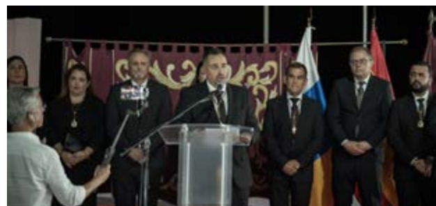
El alcalde incidió en la importancia de acoger a la Virgen de las Nieves en el municipio.

que se trata de "un acontecimiento que quedará grabado en la memoria colectiva de los vecinos y las vecinas de Mazo". Destacó, además, la emoción y la participación ciudadana vividas durante el recibimiento. El primer edil agradeció la implicación de la población, asociaciones y colectivos locales, que contribuyeron a embellecer calles y espacios públicos, así como el trabajo de los servicios municipales, concejalías y empresas colaboradoras que hicieron