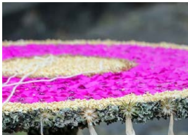
El Corpus Christi, un ejemplo de unión vecinal.

La celebración de esta fiesta del Corpus Christi data del año 1605, fecha en la que se celebró la primera procesión en los días