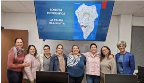
La iniciativa busca mejorar la capacitación en un ámbito con un potencial crecimiento en la isla.