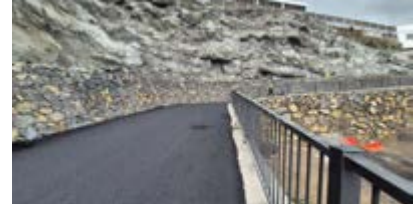
Viaro de empresas.