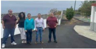
Culminan las obras de emergencia en el CEIP Princesa Arecida.