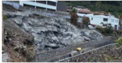
Villa de Mazo refuerza la seguridad del CEIP Princesa Arecida.