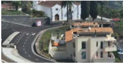
Nuevo viario Templo de San Blas.