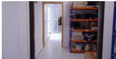
Mejora de dependencias de la Residencia de Mayores.