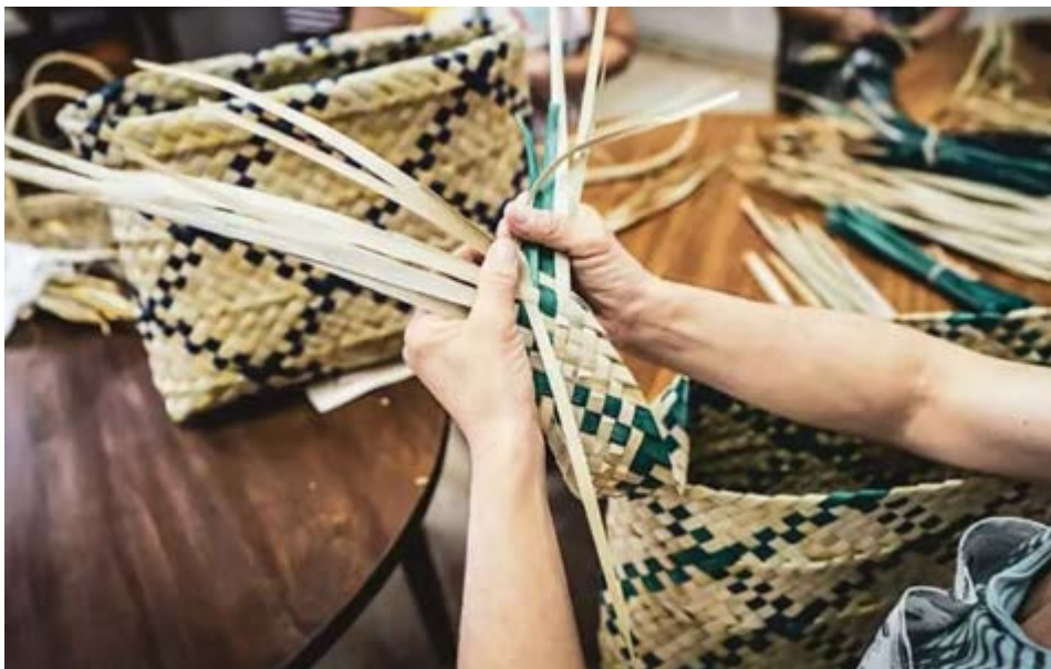
La artesanía, un pilar de Villa de Mazo.