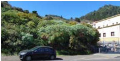
Adquisición parcela junto al Centro de Mayores.