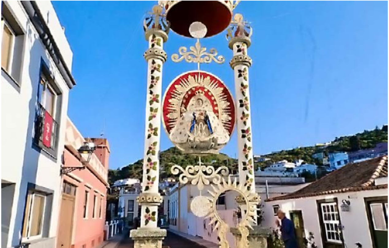
Todos los barrios macenses se implican en la celebración de esta festividad clave para el municipio.