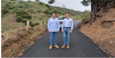
Asfaltado de la pista del Gigil.