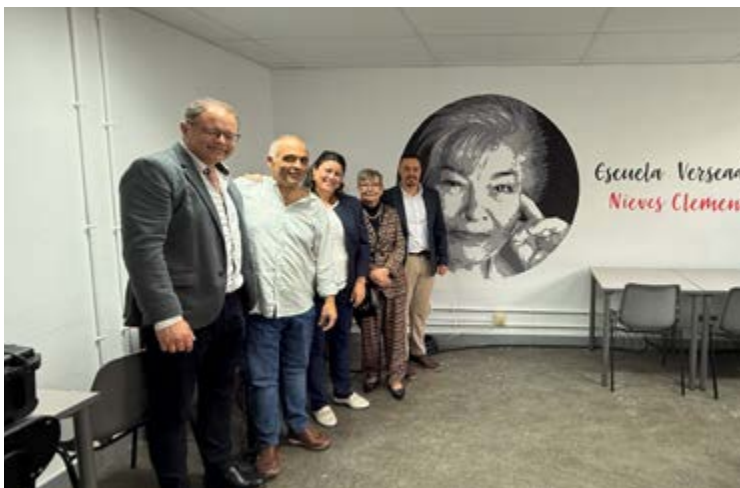
Inauguración de la Escuela de Versadores Nieves Clemente.

Villa de Mazo formó parte del acto de inauguración de la Escuela de Versadores Nieves Clemente, un reconocimiento a toda una eminencia en el conocido como repertismo canario. El acto tuvo lugar en Gran Canaria, con la presencia de varios versadores y profesionales de la poesía de distintos lugares del mundo, que se congregaron para reconocer un género literario que se ha convertido en una de las señas de identidad de la cultura canaria. La participación en este tipo de eventos supone reafirmar el compromiso de Villa de Mazo con su identidad, posicionándose como un lugar referente en la preservación de nuestro patrimonio cultural. La figura de Nieves Clemente 'La garraфона', supone para Villa de Mazo un gran nombre no solo en el ámbito literario, sino también un referente de igualdad social y un ejemplo de superación, logrando importantes hitos en un mundillo mayoritariamente masculino. Su gran talento para escribir poesías improvisadas, sumado a su lucha y dedicación abrieron camino para futuras generaciones de decimistas.