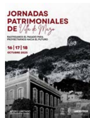
Cartel de las jornadas.

nificación ambiental, la memoria histórica y política del municipio, la imaginaria festiva del municipio y el análisis de elementos patrimoniales vinculados a la arquitectura. También contemplaron una mesa redonda dedicada a la reflexión a través de especialistas en distintas disciplinas como la filología hispánica, la sociología o la arquitectura.