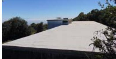
Cambio de cubierta depósito de Piedra Alta.