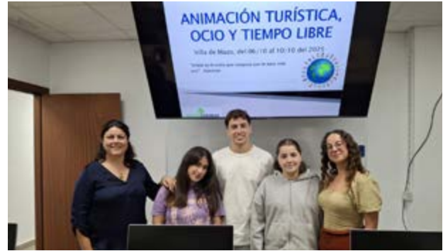
El programa permite a personas participantes conocer fundamentos de este sector clave.