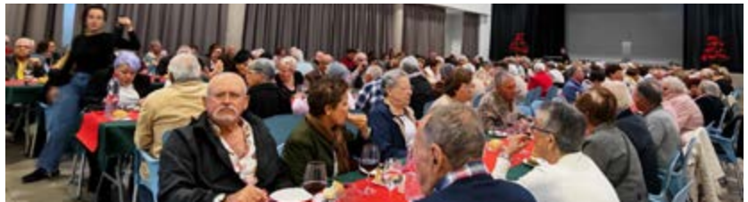
Estos encuentros promueven el bienestar, la participación y el protagonismo de las personas mayores del municipio.

A lo largo del año se han desarrollado diversas iniciativas adaptadas a sus necesidades e intereses, creando espacios de encuentro que favorecen la socialización, el bienestar emocional y el mantenimiento de una vida activa.