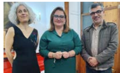
El ciclo de narración oral se consolida en el calendario cultural.