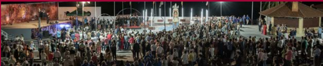
La Patrona Insular visitó el municipio entre el calor de vecinas y vecinos macenses.