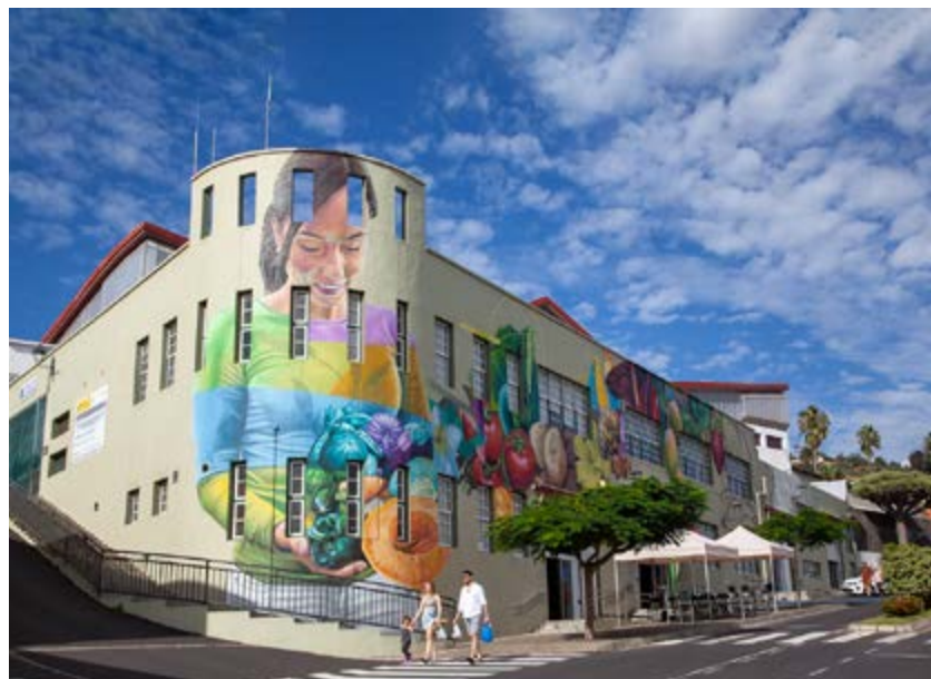
La actividad ofrece la oportunidad de conocer y degustar distintos vinos locales.