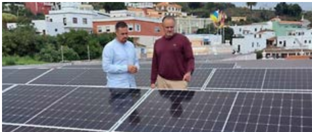
El grupo de gobierno apuesta por la transición energética.

Además, aprovechando estas mejoras, se ha realizado un aumento de la potencia eléctrica disponible en las instalaciones municipales, lo que no solo optimizará los trabajos habituales en áreas como la carpintería y la cerrajería, sino que también facilitará la próxima instalación de cargadores de recarga rápida para vehículos eléctricos. Tras la conclusión de los trabajos, el Ayuntamiento dispondrá de unas instalaciones más confortables, adaptadas a las necesidades actuales y preparadas para los retos del futuro.