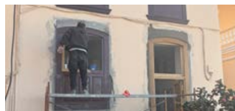
Este espacio es clave para el desarrollo económico local.

para los visitantes. Esta intervención no solo recupera y pone en valor el patrimonio arquitectónico del municipio, sino que también refuerza la promoción turística, contribuyendo al desarrollo económico local.