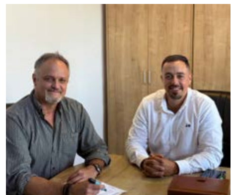
El Ayuntamiento mejora los servicios municipales.

Este impulso complementa el proyecto que se emprendió en mayo de 2024 para la instalación de placas fotovoltaicas en varios puntos del municipio, vinculadas al autoconsumo con venta de excedentes de producción eléctrica