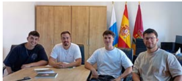
La iniciativa estuvo dirigida a personas emprendedoras y a empresas establecidas por primera vez en Mazo.

La iniciativa estuvo dirigida a personas emprendedoras y a empresas que se establecieron por primera vez en Villa de Mazo, con el objetivo de facilitar el inicio de la actividad empresarial mediante el apoyo a inversiones y gastos iniciales. Tras la experiencia de