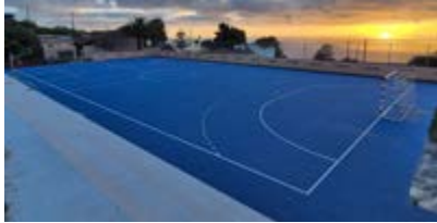
Mejora cancha Escuela Unitaria La Rosa.