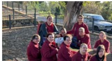
Integrantes del Centro Ocupacional Garehagua.

acercarse a las personas que mantienen viva la esencia de lo artesano.