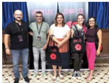
Más de 450 cortos participaron en la sección internacional.