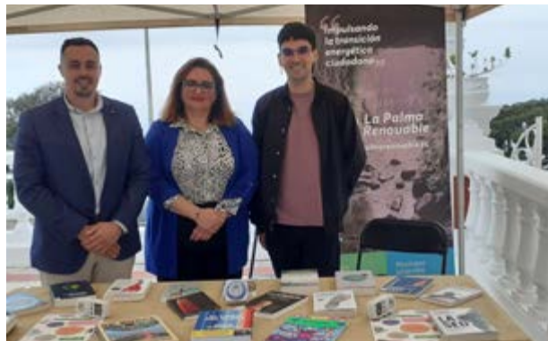
El proyecto busca promover la sostenibilidad y el uso de energías renovables mediante el intercambio de libros.