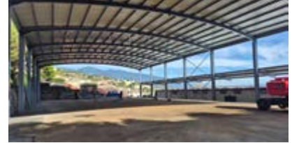
Cubierta del CEIP Arecida.