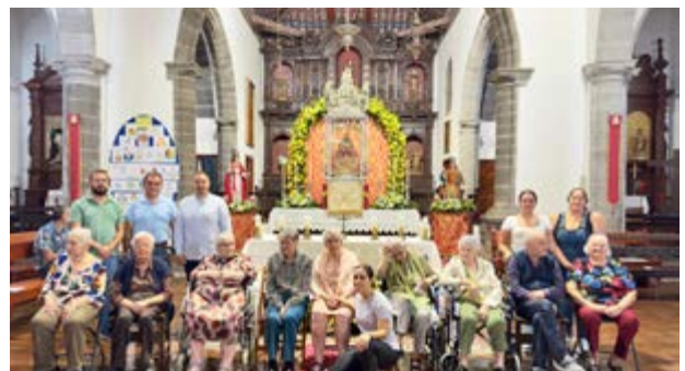
Las personas mayores, una prioridad para Villa de Mazo.