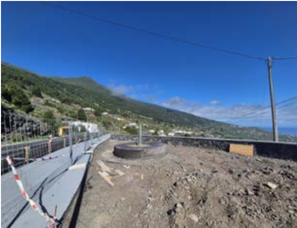
Mirador de El Lomo.