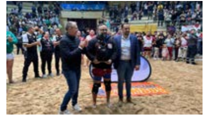
El club posiciona al municipio en el panorama deportivo.