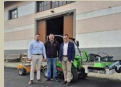
El equipo de gobierno garantiza el mantenimiento de las instalaciones.

Con esta inversión, el Ayuntamiento reafirma su compromiso con la mejora de las