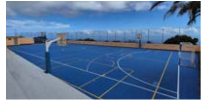
Mejora cancha Escuela Unitaria La Sabina.