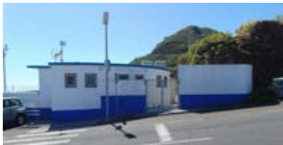
Mejora instalación eléctrica campo de fútbol.