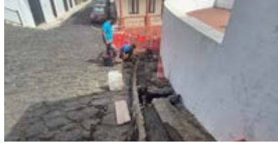
Mejora de abastecimiento de agua potable.